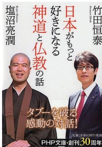
日本がもっと好きになる 神道と仏教の話 竹田恒泰／塩沼亮潤 共著 (PHP 研究所)

以上、旧皇族竹田恒泰氏・塩沼亮潤氏の著書を中心に、古事記を紹介させていただきました。