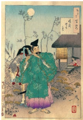
『嵯峨野の月』 (月岡芳年『月百姿』) 源仲国と小督 Wikipedia より