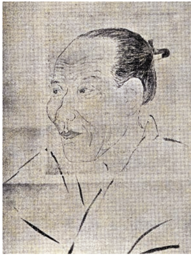
伊藤仁斎 (堀川門人による肖像)

「日本儒学」ともいえる「古義学」を起し、生涯、京都堀川を一步も出ず、市井の一学者として、弟子三千人を教え、当時の儒者の七割が古義堂の門を潜つたという伊藤仁斎こそ、まさに心優しき傑物儒者でありました。