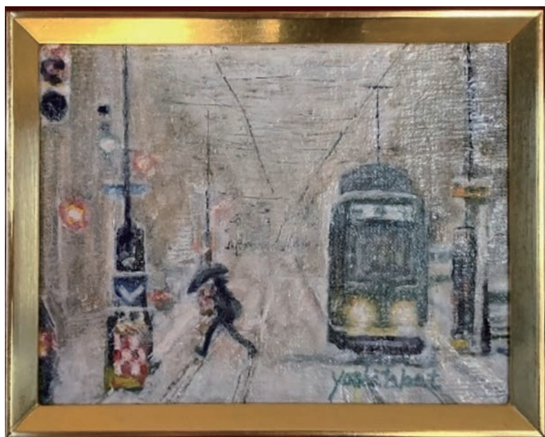
絵 「札幌の街」 愛知 高橋佳孝さん作