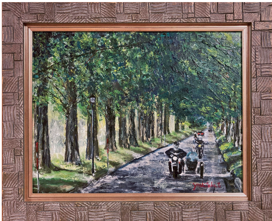
絵画「メタセコイヤ並木道」 愛知 高橋佳孝さん作