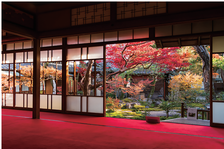
秋の旧林家（愛知県一宮市）